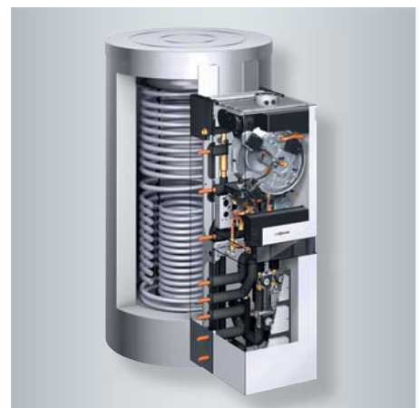
Vitosolar 300-F mit Öl-Brennwert-Heizgerät Vitoladens 300-W

Bereits ab Werk ist Vitosolar 300-F mit Heizkreisverteilung, Solarkreis Komponenten, wärmegeprägten Rohrleitungen und Absperrventilen vormontiert. Die Anschlüsse zur Einbindung eines zweiten Wärmeerzeugers, etwa eines Holzheizkessels, sind bereits vorgesehen. Alle Anschlüsse lassen sich abhängig von den Platzverhältnissen rechts oder links aus dem Gerät herausführen.