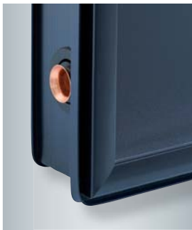
Kollektorrahmen mit speziellem Indachprofil zur Aufnahme des Eindeckrahmens

Der Hochleistungs-Flachkollektor Vitosol 300-F erzielt die besonders hohe Energieeffizienz durch den Einsatz eines speziellen, sehr lichtdurchlässigen Antireflexglases sowie einer hocheffizienten Wärmedämmung.