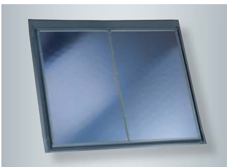
Der Großflächenkollektor Vitosol 200-F (Typ 5DIA) ist mit einer 4,75 m 2 großen Absorberfläche erhältlich.