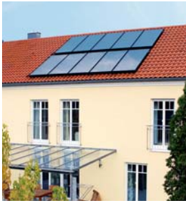
Vitosol 200-F Zweifamilienhaus Geisenfeld