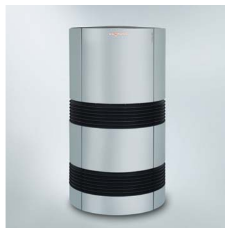
Vitocal 300-A für die Außenaufstellung

Zusätzliche Einsparungen bei den Betriebskosten werden durch die Anbindung einer Photovoltaik-Anlage möglich. Der selbst erzeugte Strom kann zum Beispiel für den Betrieb der Vitocal 300-A verwendet werden. Zusätzlich ist die Vitocal 300-A vorbereitet für Smart Grid (intelligente Einbindung von Verbrauchern in die Stromversorgungsnetze).